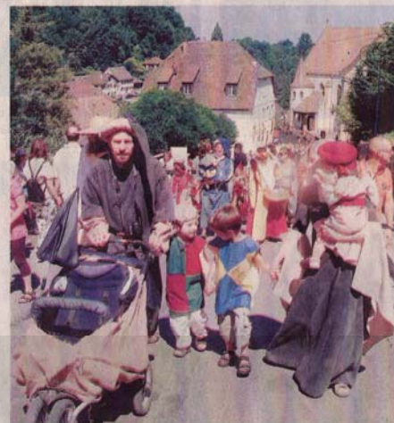
Les cortèges ont remonté la rue du Château cette année, y compris le cortège des enfants dimanche matin, avec une poussette moderne camouflée.