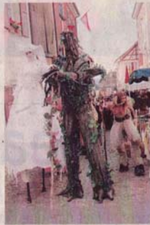
Chapeau pour les membres de la Cie La Lune d'ambre dont l'arbre et la dryade des forêts moyen-âgeuses ont arpenté sur échasses la rue pentue du Château.