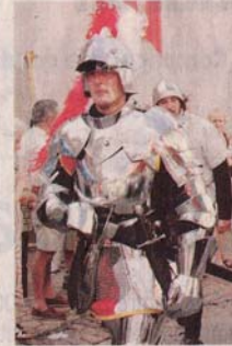
Une armure scintillante du plus bel effet.