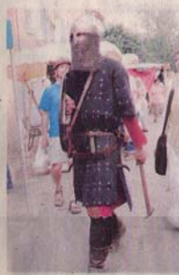
La richesse et la variété des costumes portés par les acteurs de la fête -et plus d'un aura sans doute souffert des rayons du soleil qui dardaient- ont agréablement surpris le public.

Parmi les nombreux vendeurs d'armes médiévales, d'aucuns auront remarqué la présence d'un très sympathique couple de Tchèques juste devant la mairie. Venu pour la première fois, ils ont trouvé la manifestation « formidable ». Formidable, leur stand l'était aussi: épées, masses d'armes, cotte de maille... on y trouvait tout ce dont un preux chevalier avait besoin.