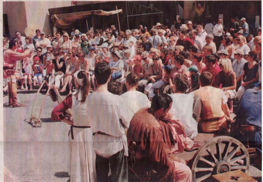
Les visiteurs sont venus par milliers flâner et s'esbaudir à Ferrette.