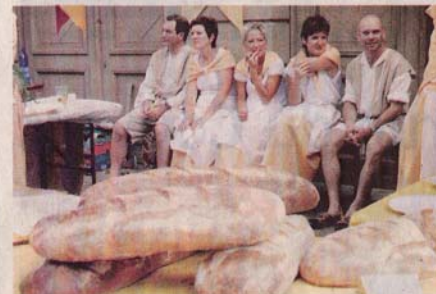
Le pain, aliment de base toujours d'actualité.