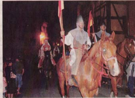
Un cavalier qui surgit hors de la nuit... au cortège nocturne des Médiévales, fort apprécié.