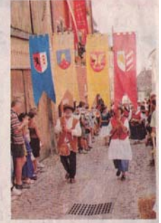
Les blasons des nobles de St-Ursanne, Rougemont, Ferrette et Habsbourg.

■ C'était l'ambiance des très grands jours ce week-end à Ferrette. Une foule en costumes, foisonnante et colorée, croisait un public ravi qui a profité de chaque instant dans le périmètre attribué à la fête, depuis l'église jusqu'au château en passant par le terrain multisports au pied du Felsenack. « C'est chaud, c'est pentu, c'est beau, c'est bien organisé et c'est vaste ! », devait résumer un des hallebardiers de Grange-le-Bourg, un groupe de Haute-Saône, venu pour la première fois et qui s'attache également dans son secteur à animer et à remettre en état son château.