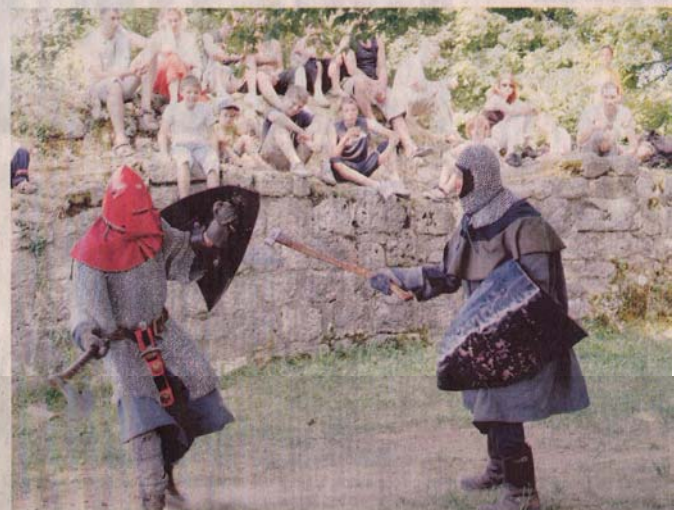
Démonstration de combat à la hache au château.